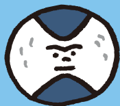
テキストデータ化