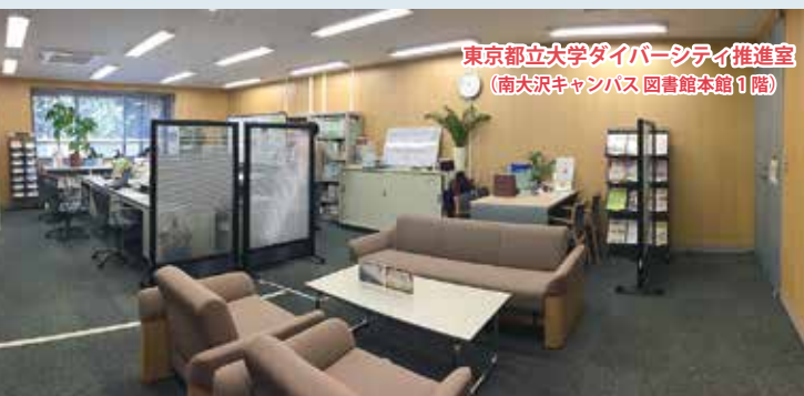
東京都立大学ダイバーシティ推進室 (南大沢キャンパス 図書館本館1階)

多様化する21世紀の魅力ある都市社会を、 新たな知の創造を追求するため、 東京都立大学では、 ダイバーシティ推進室を設置しています。