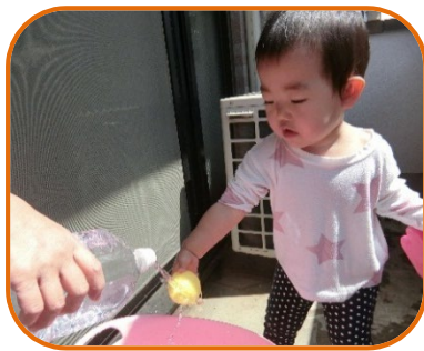
冷たくて気持ちよかったね！ ペットボトルが大活躍です。