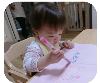
あんよの自主練習？を したり、お絵描きしたり。 好奇心いっぱいだね！