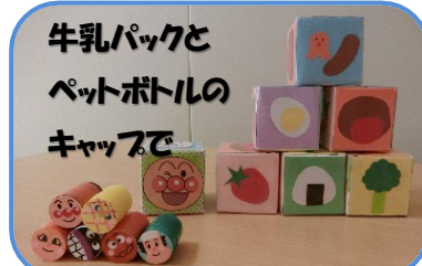
牛乳パックと ペットボトルの キャップで